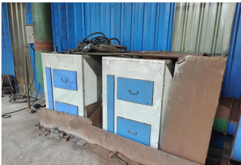
图 6-1 废气处理设施

项目制芯原料覆膜砂中主要成分为原砂、树脂等，在上料过程中会产生粉尘，制芯加热过程中将产生树脂热熔废气。本工序产生的污染物有颗粒物和非甲烷总烃。制芯工序年工作约 900h。收集到的制芯废气接入 1 套“袋式除尘器+二级活性炭”处理后，通过 1 根 15m 高的排气筒排放。