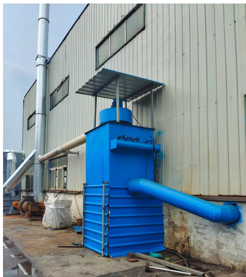
图 6-4 废气处理设施

浇注成型的铸件部分会存在边角、凹凸不平的产品，需要进行打磨作业，项目采用人工手持打磨机进行打磨，打磨工序将产生粉尘。打磨过程中金属粉尘颗粒密度、粒径较大，大部分在打磨区域自然沉降，少量微小颗粒逸散。本项目打磨粉尘配置1套“布袋除尘器”处理，与处理后的浇注废气一起通过1根15m高排气筒排放。