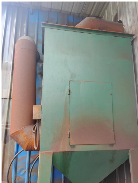
图 6-6 废气处理设施

项目铸件经开箱后,通过抛丸机进行清理铸件附着旧砂,并同时 对铸件表面进行抛光处理,抛丸过程将产生粉尘废气。抛丸年运行时间为 2400h。项目抛丸机为全封闭的室体,上部设有排风管收集抛丸粉尘,并自带有“布袋除尘器”,最后通过 1 根 15m 高排气筒排放。