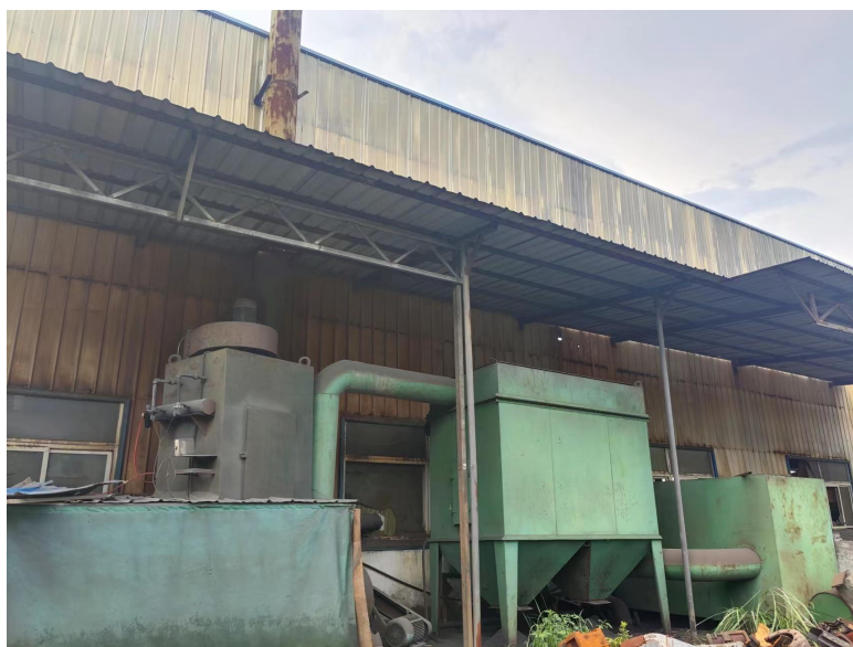
图 6-2 废气处理设施

备一用)，设置2个可旋转式顶吸集气罩。收集的熔炼烟尘接入1套“布袋除尘器”处理，最终通过1根15m高排气筒排放。