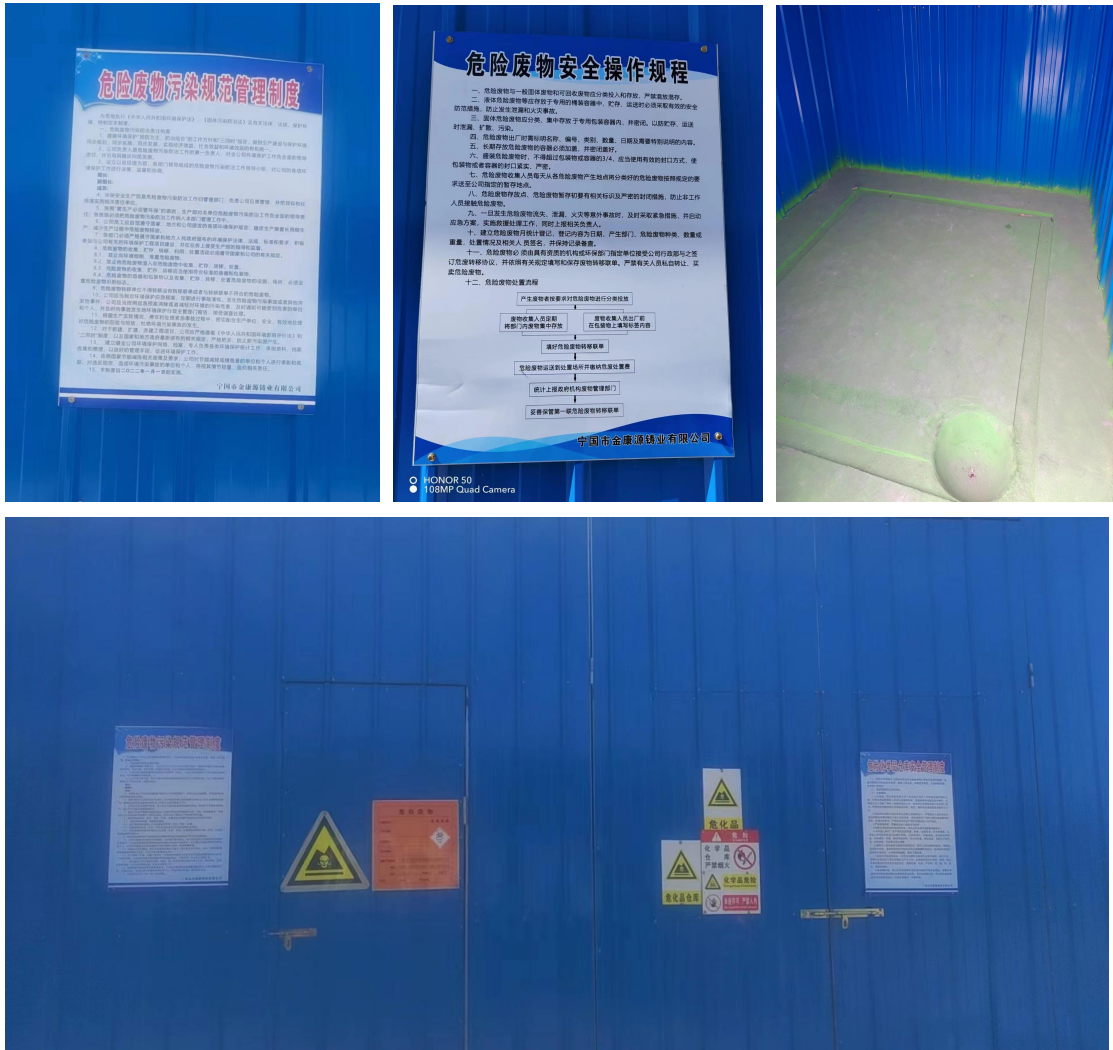
图 6-7 危废暂存场所