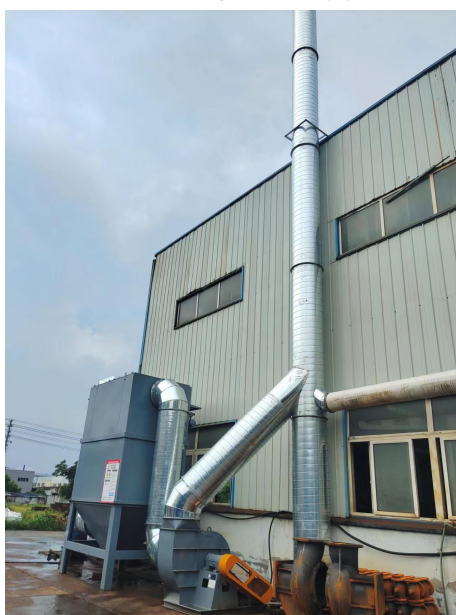
图 6-3 废气处理设施

熔化后的铁水通过重力浇注至砂箱中，高温的液态金属与砂箱中型砂等物料接触会产生热烟气，主要成分为颗粒物、非甲烷总烃和水汽。浇注年运行约2400h。收集到的浇注废气接入1套“袋式除尘器”处理后，通过1根15m高的排气筒排放。